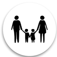
Parelles amb fills

A la Montse i el Ramon els hi encanta la natura i les activitats rurals i tradicionals. Com a pares volen transmetre aquests valors als seus fills de 4 i 2 anys, per això la parella sovint organitza excursions arreu del territori català. Valoren les zones on gaudir de la calma, passejar, rutes de dificultat baixa o mitjana i que hi hagi diferents punts on fer parades, ja siguin bars, restaurants o parcs infantils.