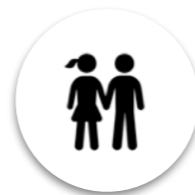
Parelles sense fills

La Mireia i el Pau sempre que poden preparen una escapada per anar a relaxar-se en un entorn natural, doncs els agrada aprofitar el cap de setmana tot relaxant-se caminant per pobles amb encant i disfrutant de les activitats que s'hi puguin fer. Una de les seves activitats preferides és el senderisme i gairebé sempre aprofiten l'excusa per fer una parada gastronòmica en algun restaurant de cuina casolana.